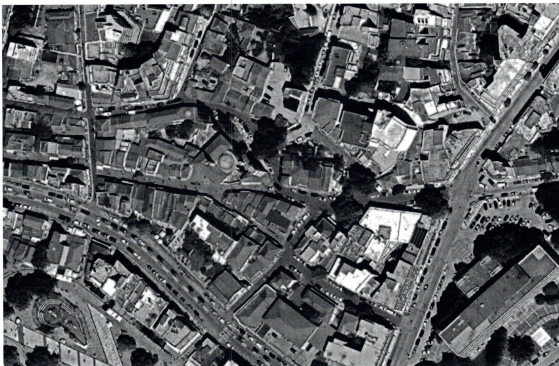
Φωτ. 1 Θέση του κτίσματος στον οικιστικό ιστό