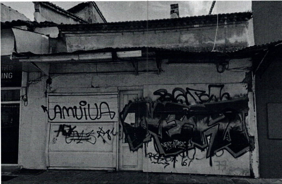
ΦΩΤΟ 2. Υποχώρηση του δεξιού τμήματος του μεταλλικού στεγάστρου. Το δεξί τμήμα της όψης είναι καλυμμένο με κόντρα πλακέ θαλάσσης ενώ το πάνω μέρος του αριστερού τμήματος είναι καλυμμένο με σανίδες και το υπόλοιπο με ξύλινο κούφωμα. Μικρές ρωγμές στο επίχρισμα της τοιχοποιίας