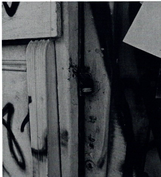
Φωτ. 3. Η είσοδος στο κτίσμα είναι σφραγισμένη με κλειδαριά που αποκλείει την πρόσβαση στο εσωτερικό του.